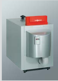
Vitocrossal 200 27 - 311 kW