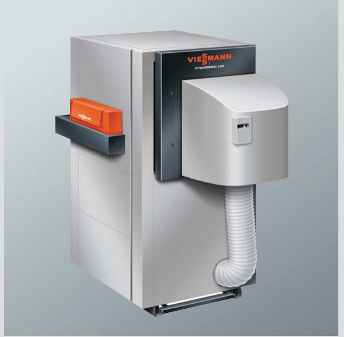
Vitocrossal 200 123 - 628 kW