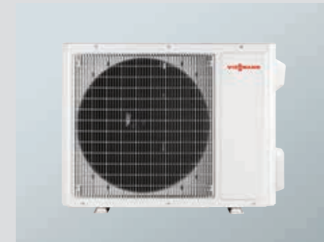
Vitoclima 100-S Duvar tipi split klima R410A, on-off Dış ünite