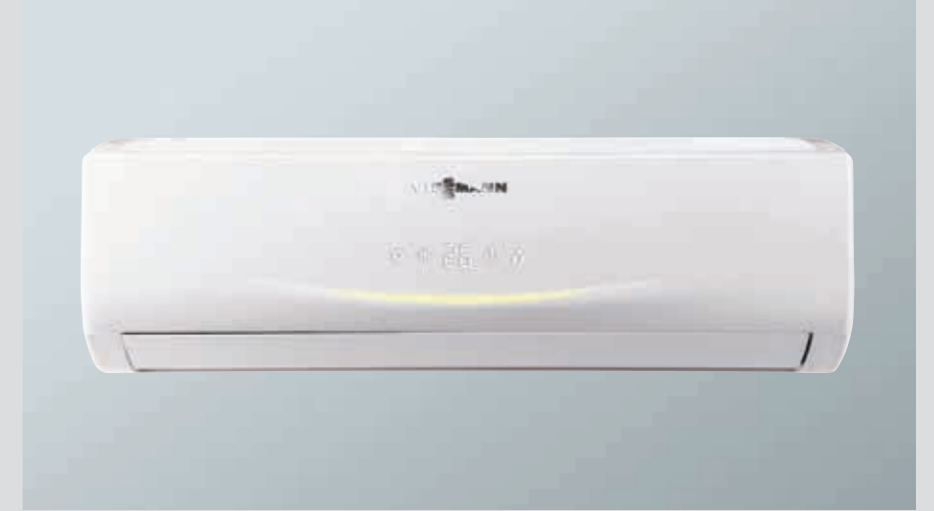
Vitoclima 100-S Duvar tipi split klima R410A, on-off 2,8 - 7,1 kW Soğutma kapasitesi