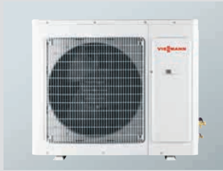
Vitoclima 200-S Duvar tipi split klima R410A, inverter Dış ünite